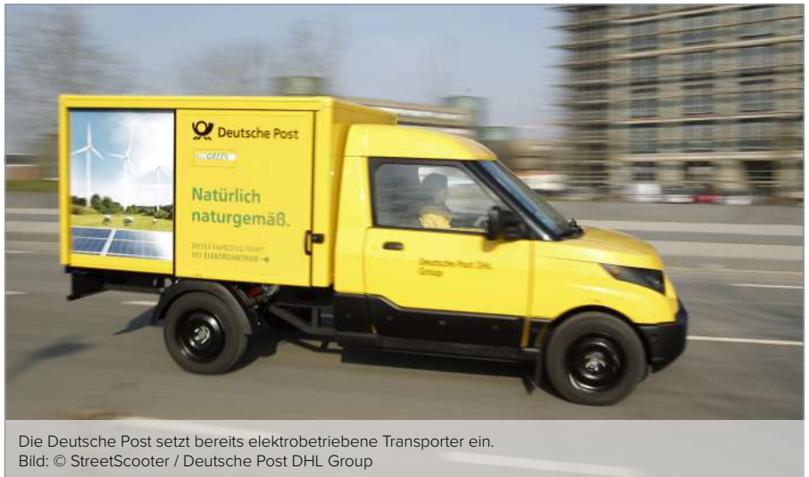
Die Deutsche Post setzt bereits elektrobetriebene Transporter ein.